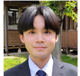
2026年着任 国語科 吹奏楽部顧問