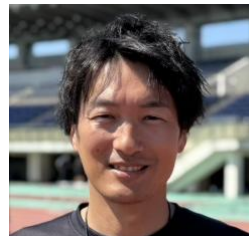
2019年着任 保健体育科 陸上競技部顧問