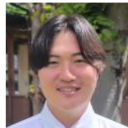
2026年着任 地歴公民科 硬式野球部顧問