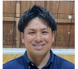
2013年着任 保健体育科 男子バレーボール部顧問