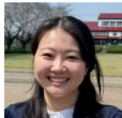
2018年着任 芸術(美術)科 美術部顧問