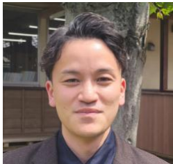
2021年着任 地歴公民科 バドミントン部顧問