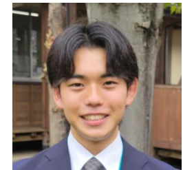
2026年着任 外国語科 テニス部顧問