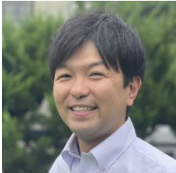
2011年着任 数学科 2学年主任